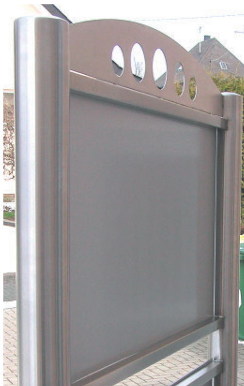
Rückseite der Schilderanlage Oslo