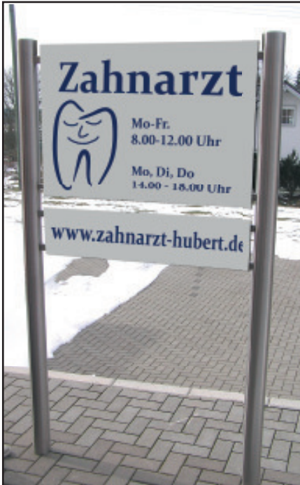
Schilderanlage Oslo, Querholme ansatzweise sichtbar, da Schildermaß 20 mm schmaler als Anlagenbreite gewählt wurde