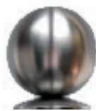
Kugel 80 mm, Edelstahl, optional erhältlich