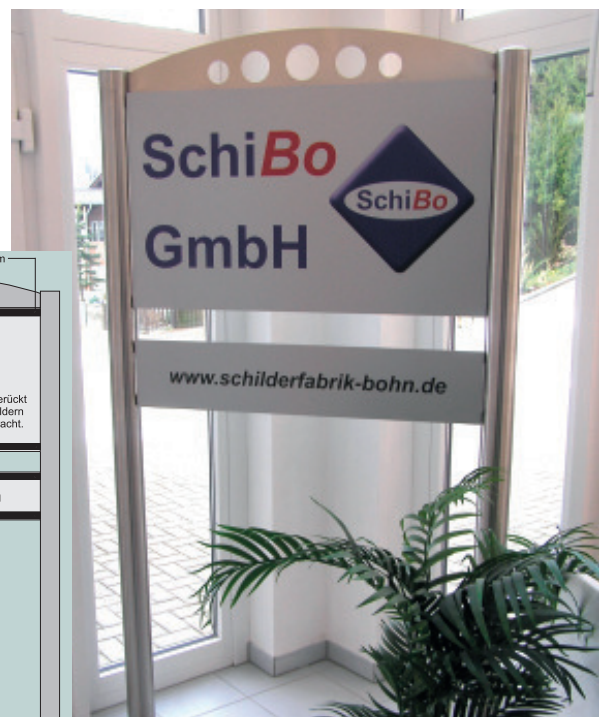
Auch im Innereinsatz, optional sind Bodenplatten aus Edelstahl lieferbar