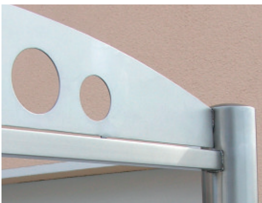
Detailansicht der Holme und des Schmuckelementes.

Wenn Sie die passenden Schilder mitbestellen, sind diese bereits montiert an der Schilderanlage angebracht (Klebmontage).