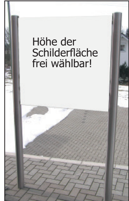
Schilderanlage Oslo, hier mit einem Schild. (2 Querholme). Die Schildhöhe bestimmen Sie selbst.