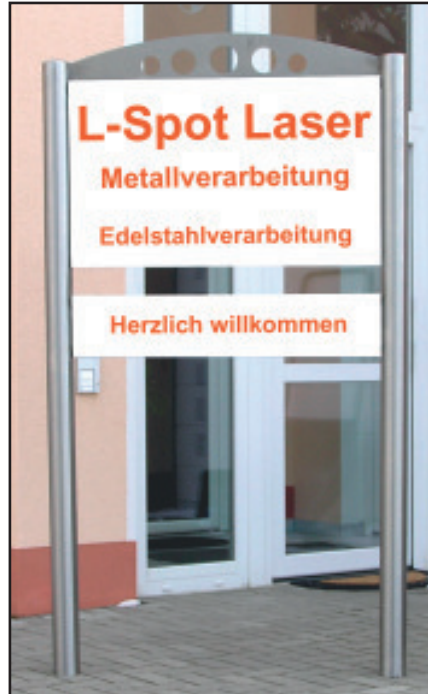
Schilderanlage Oslo, Querholme nicht sichtbar, da Schildmaß = Anlagenbreite. Es bleibt nur eine kleine Spalte links und rechts (ca. 2-3 mm)